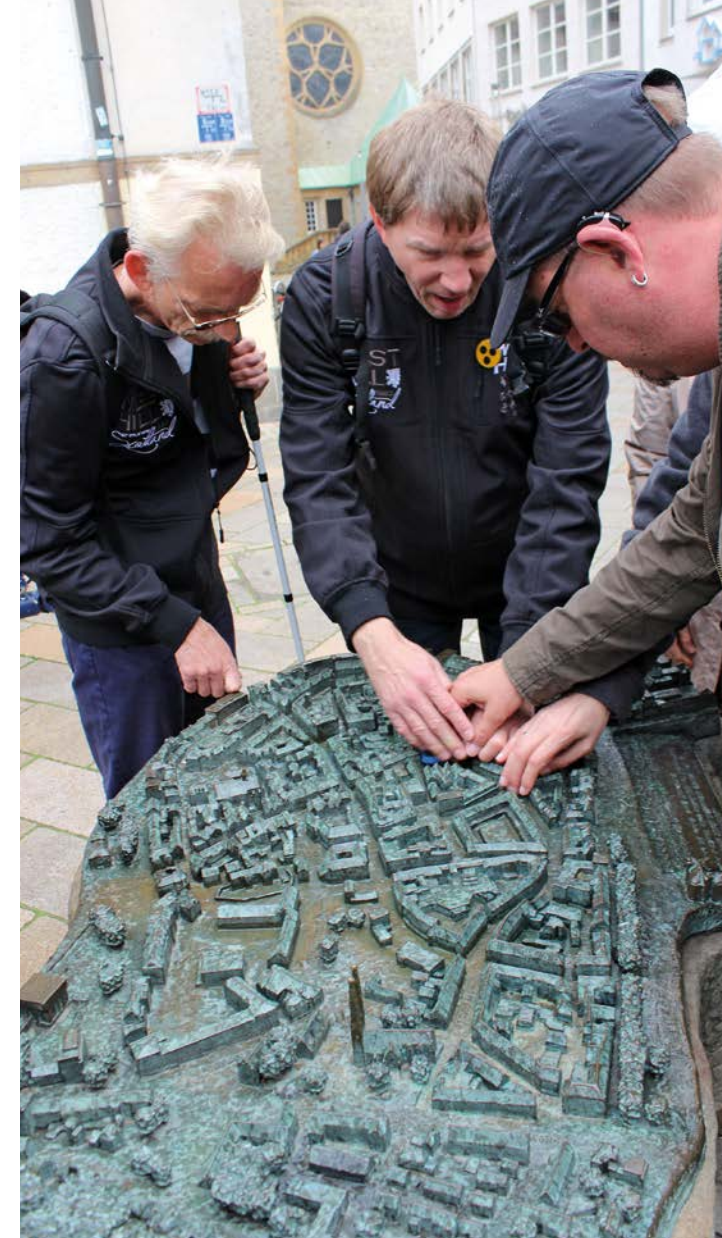
Taubblinde beim Ertasten des Stadtmodell von Bielefeld

Das Projekt erstreckt sich über einen Zeitraum von 3 Jahren von Januar 2015 bis Dezember 2017.