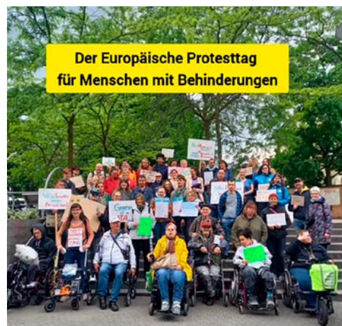
Screenshot aus dem Fikrias Video